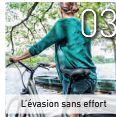
L'évasion sans effort