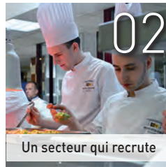
Un secteur qui recrute