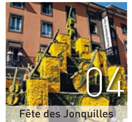
Fête des Jonquilles