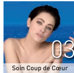
Soin Coup de Cœur