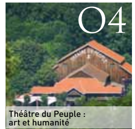
Théâtre du Peuple : art et humanité