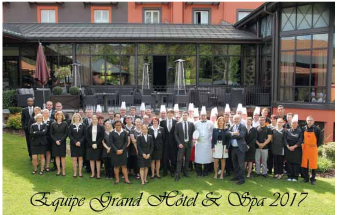
Equipe Grand Hôtel & Spa 2017