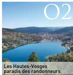
Les Hautes-Vosges paradis des randonneurs