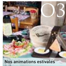
Nos animations estivales