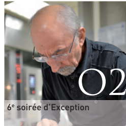
O2 6 e soirée d'Exception