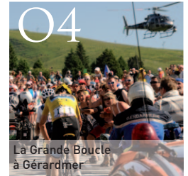
O4 La Grande Boucle à Gérardmer