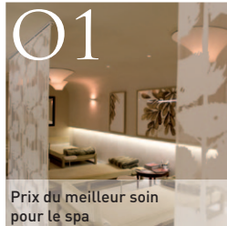
O1 Prix du meilleur soin pour le spa