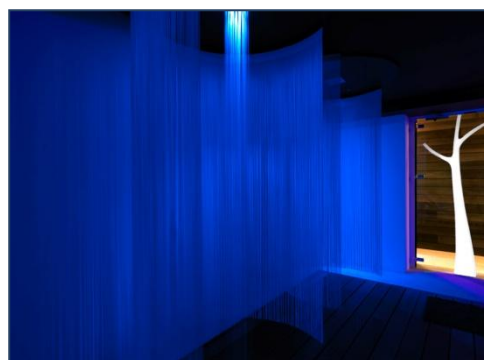
Le Heat Center, espace sensoriel

Après avoir remporté en 2012 un prix spécial, et en 2013 le prix du Meilleur Design, le Grand Hôtel & Spa de Gérardmer a donc une nouvelle fois été récompensé par Les Trophées de la Clientèle Spa, un concours organisé dans le cadre du Colloque National du Spa pour lequel les résultats sont déterminés à l'aide de questionnaires de satisfaction remplis par les clients. Les trophées se déclinent en 5 catégories différentes : Meilleur Resort Spa, Meilleur Day Spa, Meilleur Soin, Meilleur Accueil et Meilleur Design.